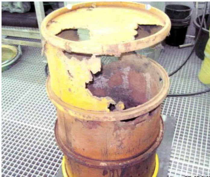
rostiges Atommüllfass in Brunsbüttel

Gute Gründe, vom Irrweg der vermeintlich sicheren Atommülllagerung in Schacht Konrad abzukommen