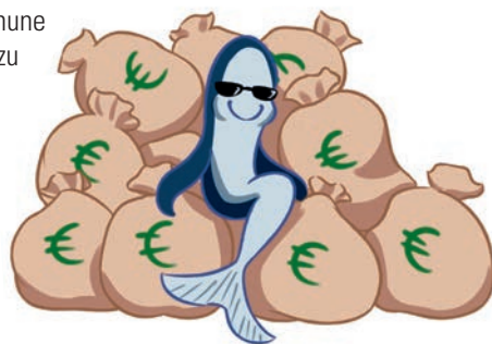
Illustration © 2017 Sophie Dinkel

Mittlerweile bestätigen Behörden und Politiker*innen: Dieser Standort wäre heute nicht mehr genehmigungsfähig.